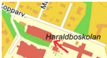
E-huset vid pilen